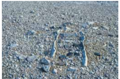
Paleoeskimaisk s.k. mittgång, för eldstad i ett tält. Från Independence-kulturen på nordligaste Grönland, cirka. 4000 år gammal.

– Fynden från området längst i norr visar att man hade ett varmare klimat på 1200-talet då man kunde färdas i området med kvinnobåten umiaq. I slutet på