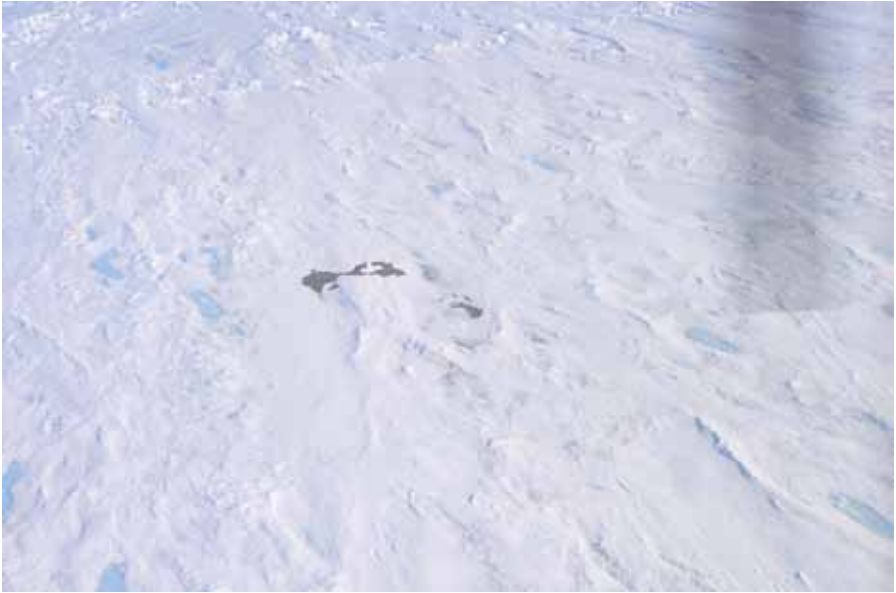
Världens nordligaste ö, Oodaaqs Ö (mindre än 100x100 m), som den såg ut från luften 1979, året efter upptäckten. Belägen strax nordost om Grönlands nordspets, mitt ute i den permanenta havsisen - och det är tveksamt om den finns kvar i dag.