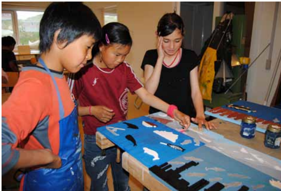
Man tager vad man haver när konst ska skapas i Kulusuk.