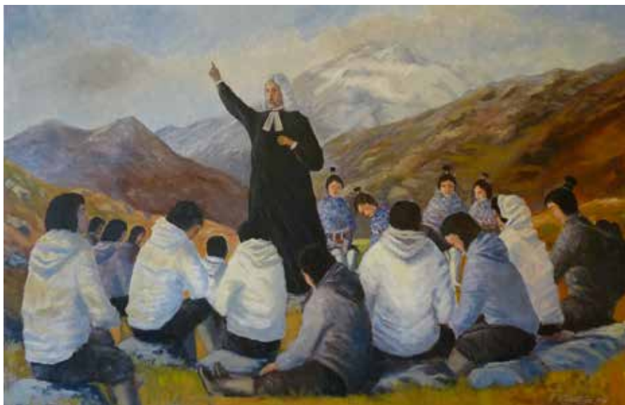
Missionären Hans Egede ansåg att grönländarna var oemottagliga för evangeliet.

Grönländarna behöll sitt eget rättssystem tills Danmark fick sin grundlag 1849.