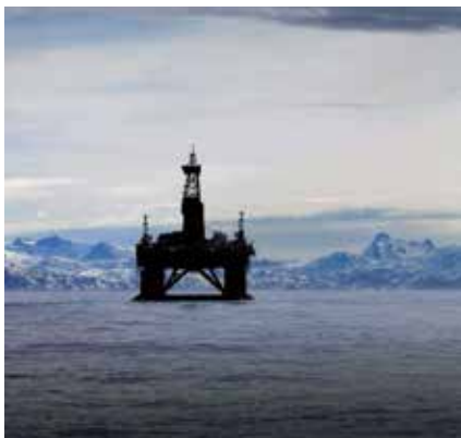
Om Grönland ska kunna frigöra sig från Danmark krävs stora satsningar på olja, gas och gruvor.

Världens femte största urantillgång finns vid Kvanefjeld på södra Grönland där australiska Greenland Minerals and Energy (GME) har långt framskridna gruvplaner.