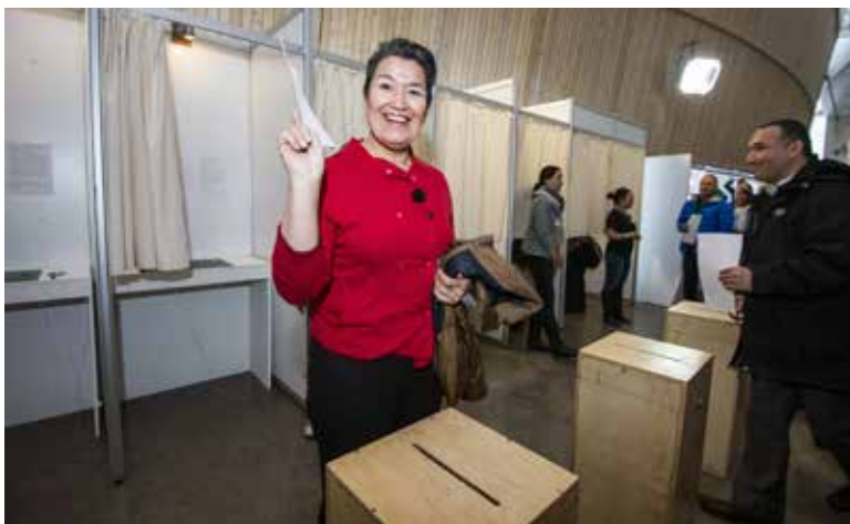
Aleqa Hammond förväntas bli ny regeringschef på Grönland.