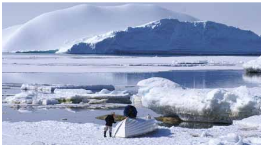
Anders Källgård har på plats studerat livet hos den grönländska ö-befolkningen.