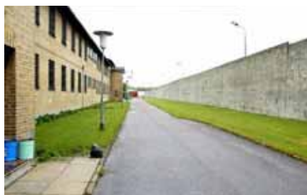
Danska fängelset Herstedvester

Den psykiatriska och psykologiska behandlingen av fångarna har blivit något av en knäckfråga för Grönlands hälsomyndigheter. De intagna önskar en egen läkarstab.