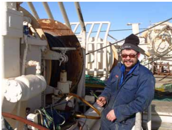
Livet på räkråla- ren bjuder inte bara på hårt arbete utan även på närkontakt med isbjörnar.

är tuffast eftersom det gäller att få en effektiv start direkt när man kommer men i slutet av perioden vill man bara åka hem.