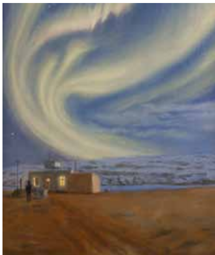
Harald Moltkes målning från en av Danmarks Meteorologiske Instituts expeditioner kring norrsken (1900).

På Naturhistoriska Riksmuséet i Stockholm pågår fram till 29 augusti