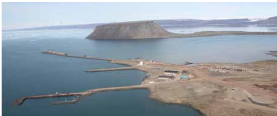
Planet med atombomber störtade nära den amerikanska militärbasen i Thule.

Det visade sig att oljan är brännbar i 72 timmar. Innan fältförsöken hade man gjort många försök med att bränna olja i laboratorium och dessa försök verifierade resultaten i Barents Havsförsöken. Avbränning är en effektiv och enkel metod som fungerar särskilt bra i arktiska förhållanden. Oljan emulgerar långsamt tack vare isens dämpande effekt på vågrörelserna och har därför ett lågt vatteninnehåll, avdunstningen är låg och isen hindrar oljan att sprida sig. Det är nämligen en förutsättning att oljan är sammanhängande och har en viss tjocklek.