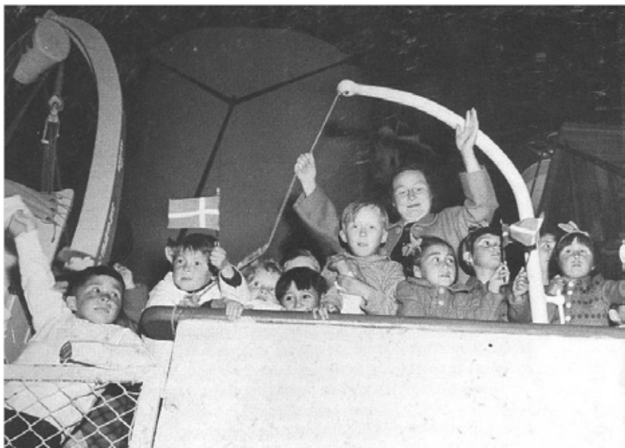
De grönländska barnen vid ankomsten till Danmark med båten Disko sommaren 1951.