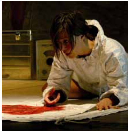
Grönländska Nukåka Coster-Waldau spelar en av huvudrollerna i filmen om experimentet med grönländska barn.

– Mina syskon talar bara grönländska och jag bara danska så det blev lite av en kulturkrock, säger Carla Lucia Knakkegaard till Grönlands Radio.