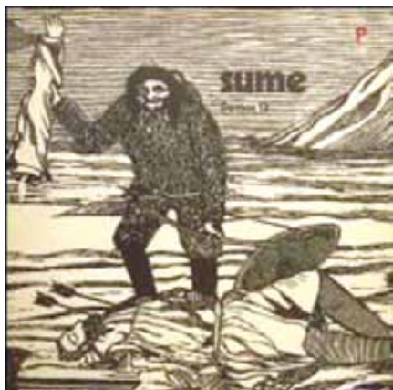
Sumes första skiva Sumut slog ner som en bomb.