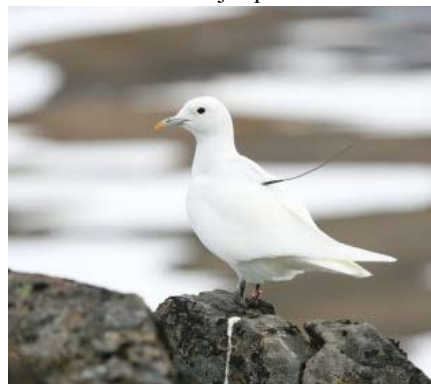
Ismåsar med radiosändare.

18 ismåsar på Svalbard och Franz Josef Land har försetts med satellitsändare och deras färd kan nu följas på internet