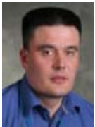
Grönlands måringsminister, Kim Kielsen, hoppas på stora inkomster från uran-brytning.