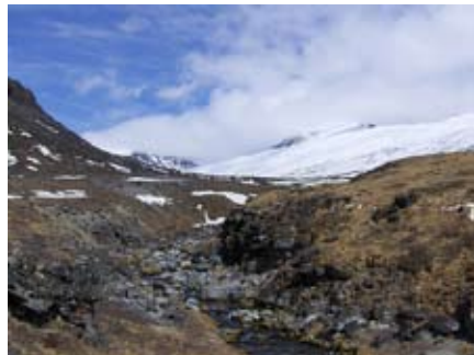
Kvanefjeldet kan ruva på uran.

I dessa studier ingår även förekomster av andra grundämnen som till exempel litium, niob, torium och zink.