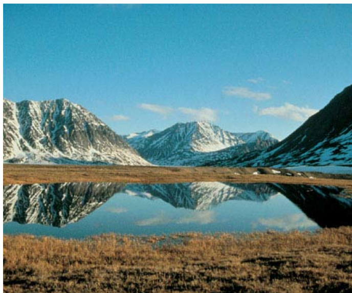
Claverings Ö är strålande vacker.

Thulekulturens försvinnande från Nordöstgrönland bekräftar forskarnas teori att högarktiska fångst samhällen trivs bäst i torra och kalla perioder med ett stabilt och förutsägbart klimat. Invånarna på Claverings Ö var helt beroende