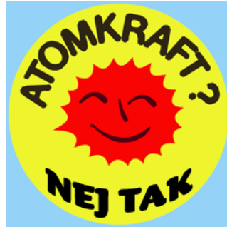
Det kan vara läge att damma av det klassiska sloganet om nej till atomkraft.

Flera gruvbolag har redan gjort skrivbordsstudier av tänkbara uranförekomster på Grönland.