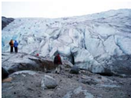
Gruppen besöker inlandsisen.

Kanske är det en effekt av klimatets tidigare förändringar vi ser, när vi står inför resterna av nordbornas bosättning i Hvalsö. Ingen vet, men efter anteckningen om ett bröllop 1408 har nordborna inte hörts av. Vid det laget började den ”lilla istiden”, men nu är det ju den nya värmeperioden som världen oroar sig för. För Grönland, däremot, skulle högre genomsnittstemperatur kunna vara av godo – ifall det därmed går att odla mer nyttoväxter inom landet – men när vi åker från