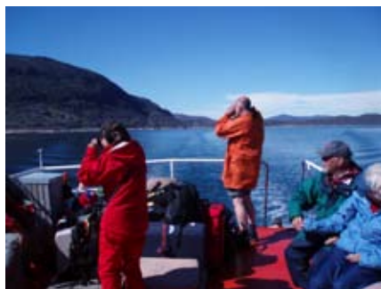
På spaning efter val och säl.