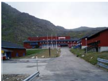
I Qaqortoq bodde svenskarna på Sulisarut Højskoleiat.