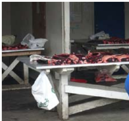
Köttförsäljningen ovanlig syn för en svensk.

när jag passerar förbi dem och vill ofta kommunicera med mig med kroppsspråk eller papper och penna vilket är en annorlunda reaktion jämfört med Sverige där man är stela och kan verka vara otrevliga mot nykomlingar.