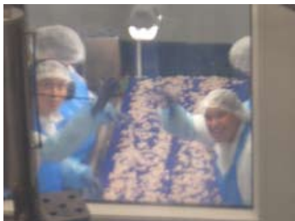
Linäs jobbkompisar vinkar genom fabriksrutan.