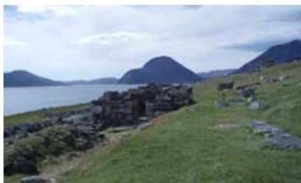
Ruinen efter Hvalsö kyrka från år 1300.