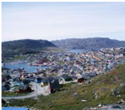
Den svenska gruppen besökte bland annat Qaqortoq.

Nu är resenärerna hemma och har naturligtvis mycket att berätta om sina upplevelser. Vill du ta del av reseäventyret kan du besöka Föreningen Natur och