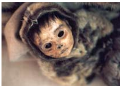
Qilakitsoq-mumie. Foto: Erja-Riitta Salonen.

Polarfronten i bearbetning av Sylvia Hild