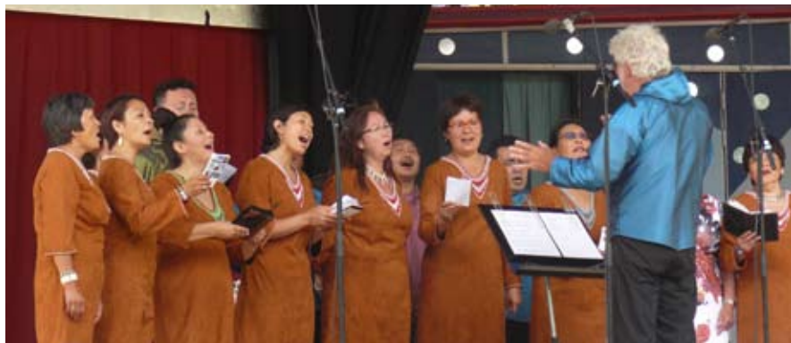
Aavaat-kören består till stor del av grönländare som är bosatta i Danmark. Kören grundades 1996.