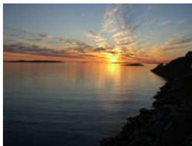
Solnedgång över Aasiaat.