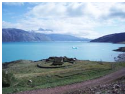
Forskare är inte längre säkra på att detta är platsen för Eriks den Rödes gård.