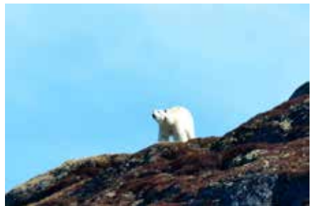
Klaus Eugenius fångade isbjörnen på bild.

2 juni rapporterades ännu en isbjörn som kom simmande i vattnet utanför Nuuk. En varning utgick till allmänheten att hålla sig borta från området vid Nipisat på Nordlandet. Nu har isbjörnen skjutits.