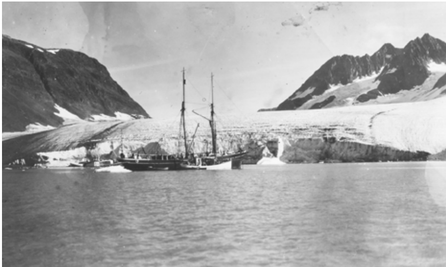
Knud Rasmussens bilder ger inblick i isens utbredning på 30-talet.